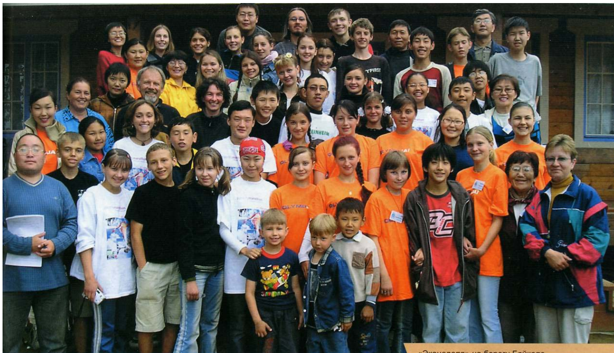
«Эконеделя» на берегу Байкала

уменшей решать экологообразовательные задачи. Влияние «Грани» для меня, например, кажется намного выше, если сравнить с деятельностью неправительственной организации в Германии – если вообще такое сравнение можно делать.